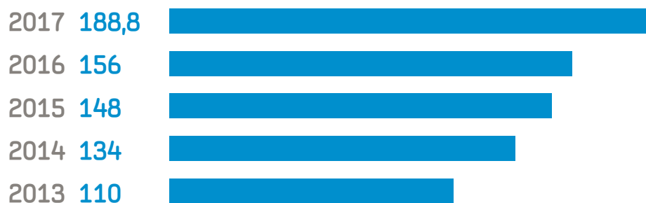
СРЕДНИЙ БАЛЛ САМООЦЕНКИ УРОВНЯ ОТКРЫТОСТИ ПО ФОИВ